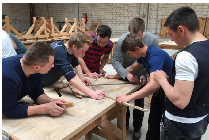
Winkel für Schmiegen konstruieren