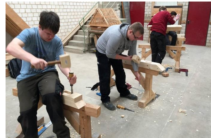
Schüler der BFS Bau 1