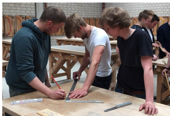
Auszubildende der Fachstufe 1